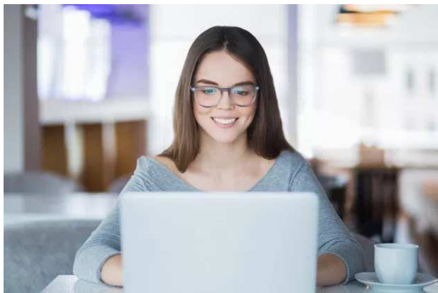
Utilisez des mots de transition

Un article bien a r  sera toujours facile   lire. Pensez   raccourcir vos phrases, ne d passez pas 20 mots si possible. Utilisez des mots et expressions de transition comme: en premier lieu, de plus, d'ailleurs, etc. Vous pouvez t l charger ce PDF qui contient grand nombre de mots de transition.   la fin de l'article vous trouverez une liste des mots de transition ou vous pouvez t l charger le PDF   ce lien: Mots de transition ( https://opticismarketing.com/wp-content/uploads/2018/01/Mots-de-transition.pdf )