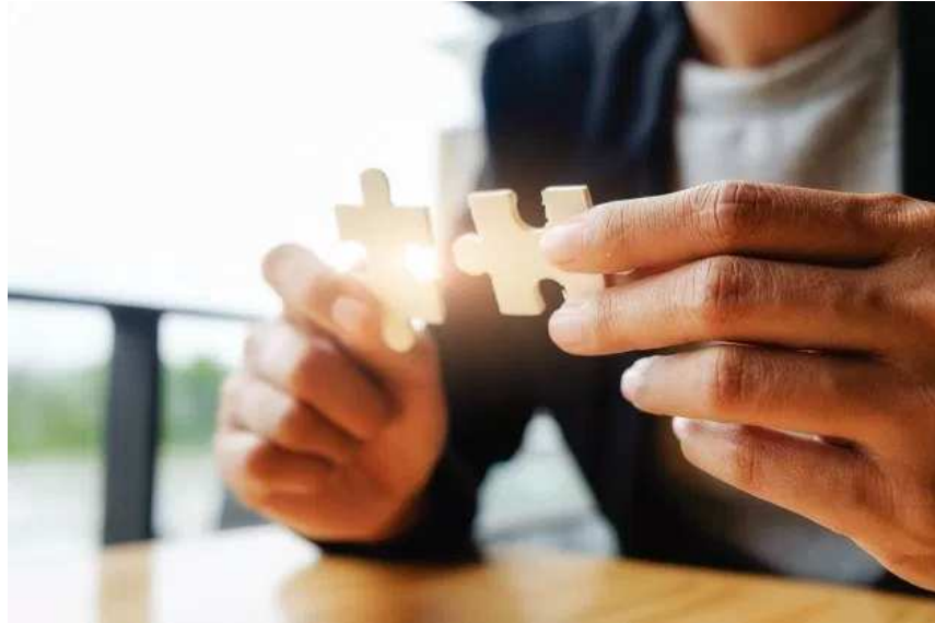
Mettre   jour les informations

Est-ce que votre article est toujours d'actualit ? Si vous n'utilisez pas les dates pour identifier vos articles dans le temps, v rifiez que l'information est toujours d'actualit . Trouver des articles qui contiennent des informations d su tes est d plaisant, surtout quand nous ne savons pas quand cet article a  t   crit. Cela peut m me devenir une fausse information, si le contexte   chang .